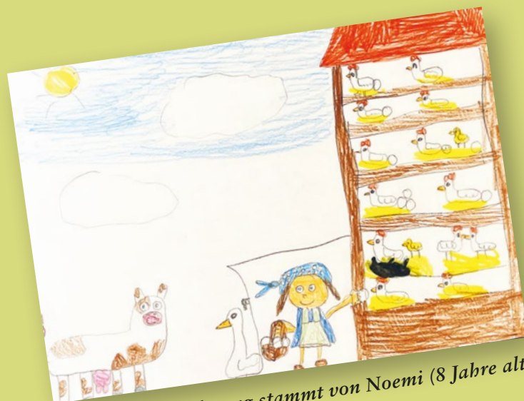
Diese Zeichnung stammt von Noemi (8 Jahre alt)

Schicke dein Kunstwerk an: KAGfreiland, Bachmattweg 18, 5000 Aarau oder via E-Mail info@kagfreiland.ch . Bitte vergiss nicht, deinen Vor- und Nachnamen, deine Adresse sowie dein Alter anzugeben. (Einsendeschluss ist Ende Oktober 2024)