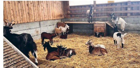
Ein Paradies für Ziegen

der Aufzucht- und Mastrindern. Den Sommer kann das Jungvieh auf der Alp geniessen. Der Betrieb hat zudem die Bewilligung für die Hoftötung. Ein Teil der Rinder wird auf dem Hof stressfrei getötet. Das Fleisch aus Hoftötung wird direktvermarktet. Für die Zukunft plant die Familie Gabathuler die Milchviehhaltung auf muttergebundene Kälberaufzucht umzustellen. Dadurch können die Kälber bei ihren Müttern bleiben und werden nicht mehr separat aufgezogen.