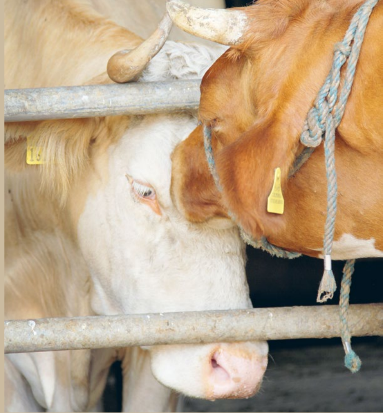
Auslauf für Rindvieh ist gesetzlich nicht vorgeschrieben

Die Einzelhaltung von sozialen Tieren darf nicht zulässig sein. Derzeit ist die Einzelhaltung von Kälbern, Schafen, Ziegen, Pferden und Kaninchen zugelassen und in der Praxis gang und gäbe. KAGfreiland fordert ein Verbot der durchgängigen Einzelhaltung. ■