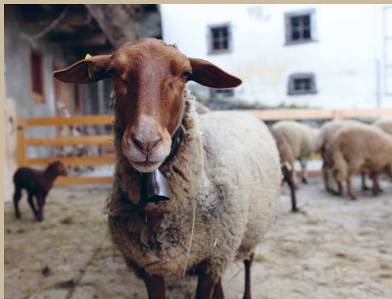
Schwanzkürzen soll bei Schafen verboten werden

Derzeit ist es erlaubt, die Schwänze von Lämmern bis zum siebten Tag nach der Geburt ohne Schmerzausschaltung zu kürzen. Diese uralte Praxis dient dazu, das Risiko einer Infektion durch verschmutzte Schwänze zu reduzieren. Aus Sicht des Tierwohls ist mindestens eine Schmerzausschaltung während des Eingriffs nötig. Noch besser ist der Vorschlag, dass das Kürzen gänzlich verboten wird.