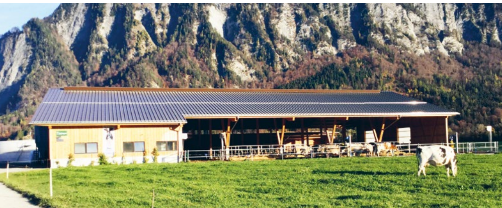
Der Rütihof in Landquart ist neu ein KAGfreiland -Betrieb

Nebst Kühen, Ziegen und Schweinen leben noch zehn Legehennen mit Hahn sowie drei Esel und zwölf Pensionspferde auf dem Rütihof. Alle Tiere haben vorbildlich viel Platz und Auslauf zur Verfügung. Zudem werden diverse Kulturen wie Brotweizen, Leinen, Dinkel und Gemüse auf dem Betrieb angebaut. Nebst den genannten Fleischprodukten werden im Hofladen des Rütihofs Eier, selbstgemachte Glace sowie Mehlprodukte und Teigwaren aus dem angebauten Getreide und diverse Gemüsesorten verkauft. Das Fleisch kann auch in grösseren Mengen beim Rütihof bestellt und abgeholt werden. ■