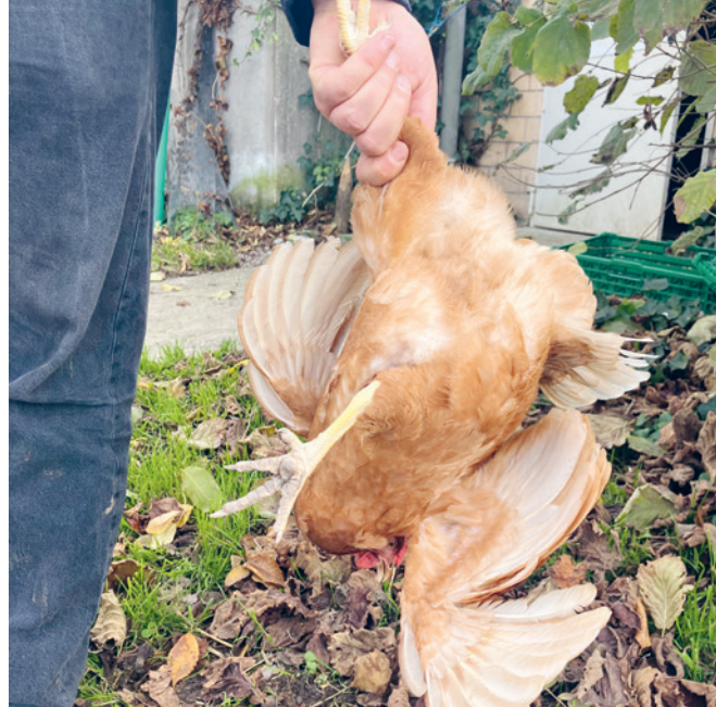
Bei der konventionellen Methode werden die Hennen an einem Bein kopfüber getragen und in Kisten gepackt