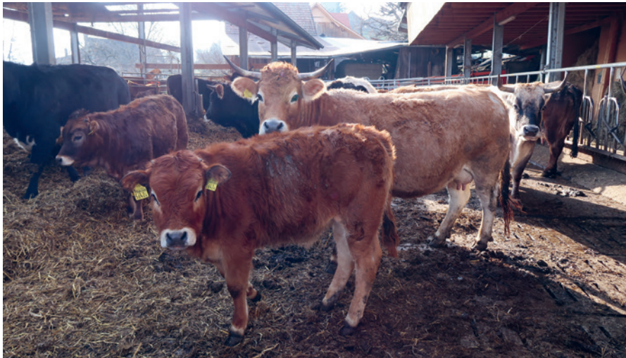
Raus an die Luft: Für Rindvieh in Laufstallhaltung ist Auslauf ins Freie in der Schweiz gesetzlich nicht vorgeschrieben.

Hier setzt die Auslauf-Initiative an. Sie ist nicht ausformuliert, sondern wird in der Form einer sogenannten «Allgemeinen Anregung» eingereicht. Das bedeutet: Die Initiative formuliert nur den politischen Auftrag, nicht den genauen Gesetzestext. Wenn sie von der Bundesversammlung angenommen wird, ist das Parlament verpflichtet, einen Umsetzungsvorschlag zu erarbeiten und zur Volksabstimmung zu bringen. Lehnt die Bundesversammlung die Initiative schon vorgängig ab, kommt es zu einer ersten Volksabstimmung, wobei nur das Volksmehr benötigt wird.