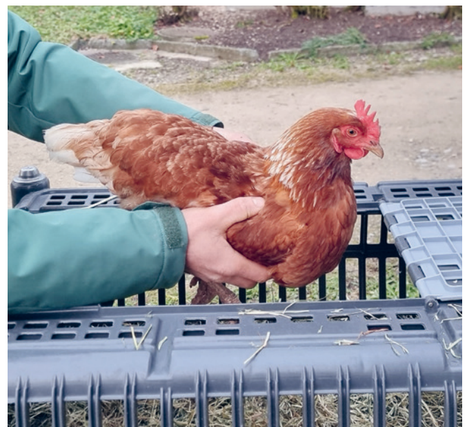
Mit der neuen Methode werden die Hennen aufrecht getragen und in Kisten gepackt