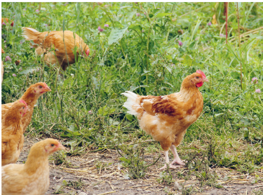
Masthühner auf einer grünen Wiese: In der Schweiz eine Seltenheit.

Bevor die Initiative offiziell lanciert wird, läuft derzeit die dreimonatige Vorkampagne. Eine Volksinitiative benötigt Ressourcen: Leute, die mithelfen, Unterschriften zu sammeln und natürlich finanzielle Mittel, um die Kosten der Initiative zu decken. Ziel ist es 20'000 Menschen zu gewinnen, welche die Initiative mit zugesicherten Unterschriften und/oder mit Spenden unterstützen. Wenn dieses Fundament erreicht ist, wird die Unterschriftensammlung offiziell gestartet, frühestens im Frühling 2026. Wie man mithelfen kann sowie viele weitere Fragen und Antworten erfährt man auf der Homepage: www.auslauf-initiative.ch ■