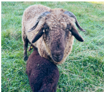
Ein Walliser Landschaf mit Lamm

Auf Gaia's Farm gackern zudem 80 Legehennen der Rasse «Schweizer Huhn». Das sind keine Hochleistungs-Hybriden, sondern echte