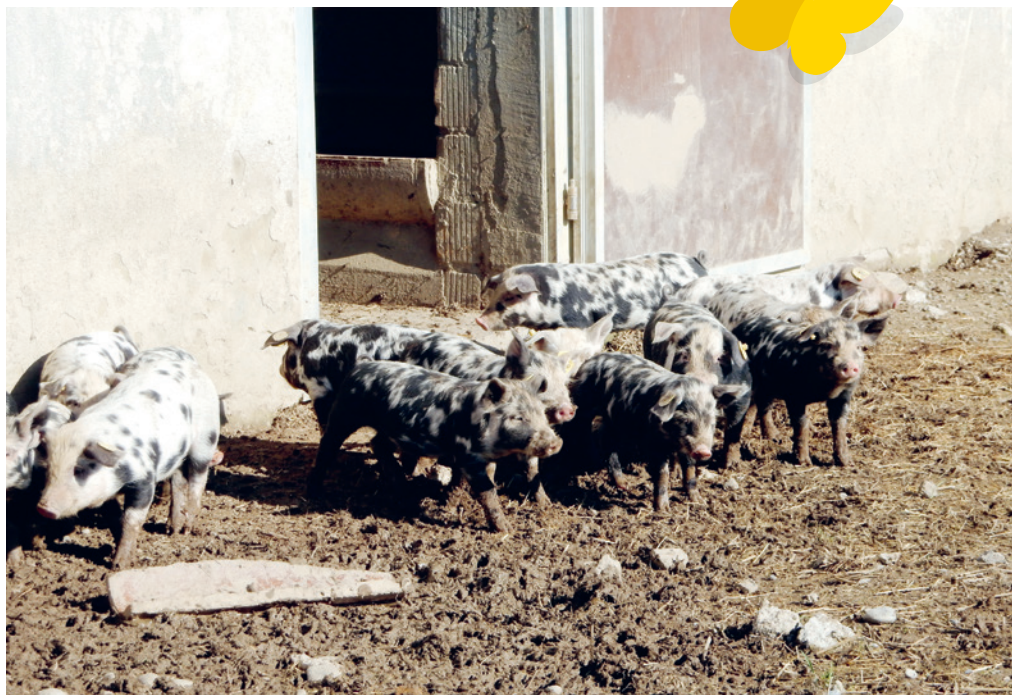
Nur rund 50 Prozent aller Schweine in der Schweiz dürfen ins Freie.

Die Volksinitiative mit dem Titel «Eidgenössische Initiative für regelmässigen Auslauf ins Freie zugunsten aller landwirtschaftlich gehaltenen Tiere» ist in der Form einer allgemeinen